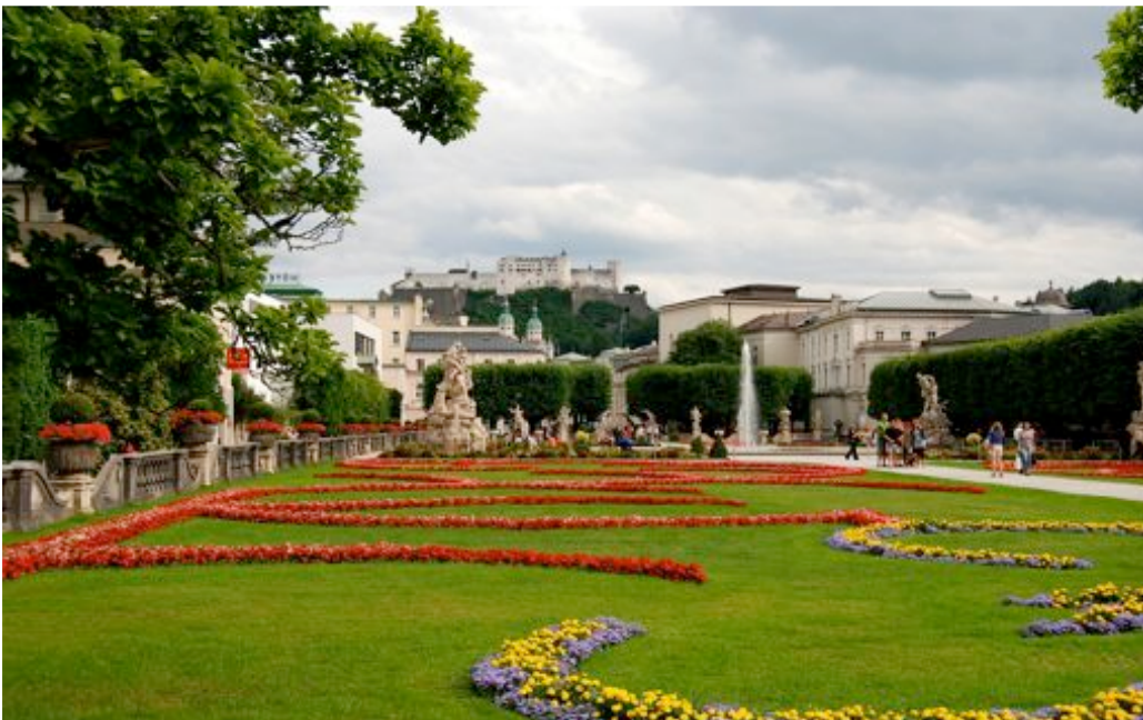
Mirabell linnan puisto

Aluksi kävimme katsomassa kaunista barokkityylistä Mirabell linnan puistoa, jonka jälkeen lähdimme kohti Salsach joen toisella puolella sijaitsevaa vanhaa kaupunkia. Matkalla ohitimme Mozartin kotitalon, jossa hän asui 24- vuotiaaksi.