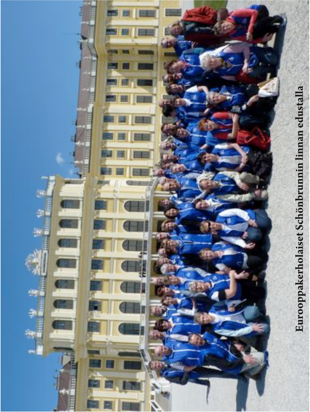
Eurooppakerholaiset Schönbrunnin linnan edustalla