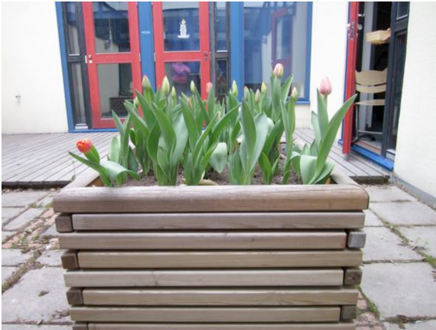
Vuoden 2010 satoa.

1. luokan oppilaat istuttavat tulppaanin sipulit koulun alueelle vanhempien opastuksella. Lisäksi kaikki nauttivat yhdistyksen tarjoamat munkit ja mehut, sekä seikkailevat tempuradalla. Illan tarkoituksena on tutustuttaa uudet tulokkaat yhdistyksen toimintaan.