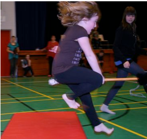
Vauhdin hurmaa keppariesteradalla.

Vauhtia ja vaarallisia tilanteita tempuradalla.