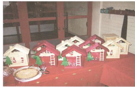
Joulumyyjäiset 2002 - 4 lk/suurluokan tonttutaloja

Joulukuussa järjestetään joulumyyjäiset, jossa jokaisella luokalla on myyntipöytä ja vanhempainyhdistyksellä puffetti.