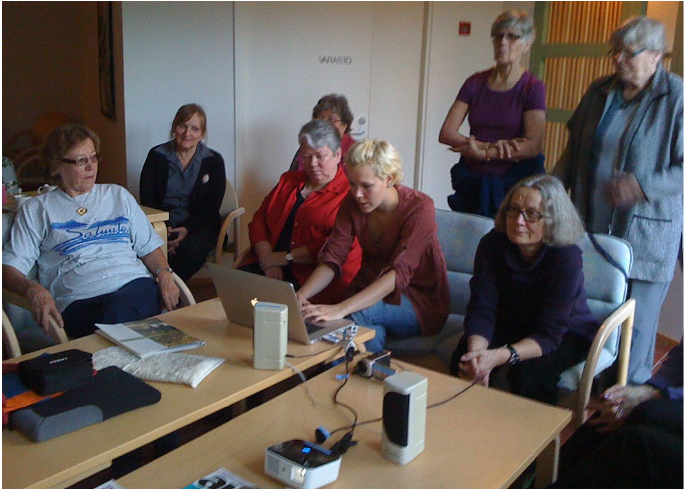
Kaikki saivat sanoa mielipiteensä myös videon editoinnissa, ja lopputuloksesta tulikin loistava!

Luotsit ottivat kannettavan ja tykin mukaansa ja hieman editoivat saatua aineistoa huoneissaan. Kello 11 aikaan hekin kävivät nukkumaan.