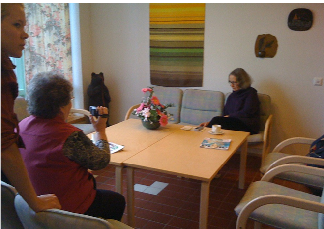
Pienen totuttelun jälkeen näytteleminen ja videon kuvaaminen sujui hyvin

Seuraavana päivänä aamulla katsottiin, missä nyt oltiin ja keskusteltiin siitä, mitä vielä puuttuu, kuka tekee jne. Koska kaikkia ei tarvittu videoinnissa, niin yksi luotseista lähti tekemään muiden kanssa kuvakertomusta talkoista ja ringistä. Osa seurasi tarkkaan molempia toimia. Samalla opeteltiin kuvankäsittelyä.