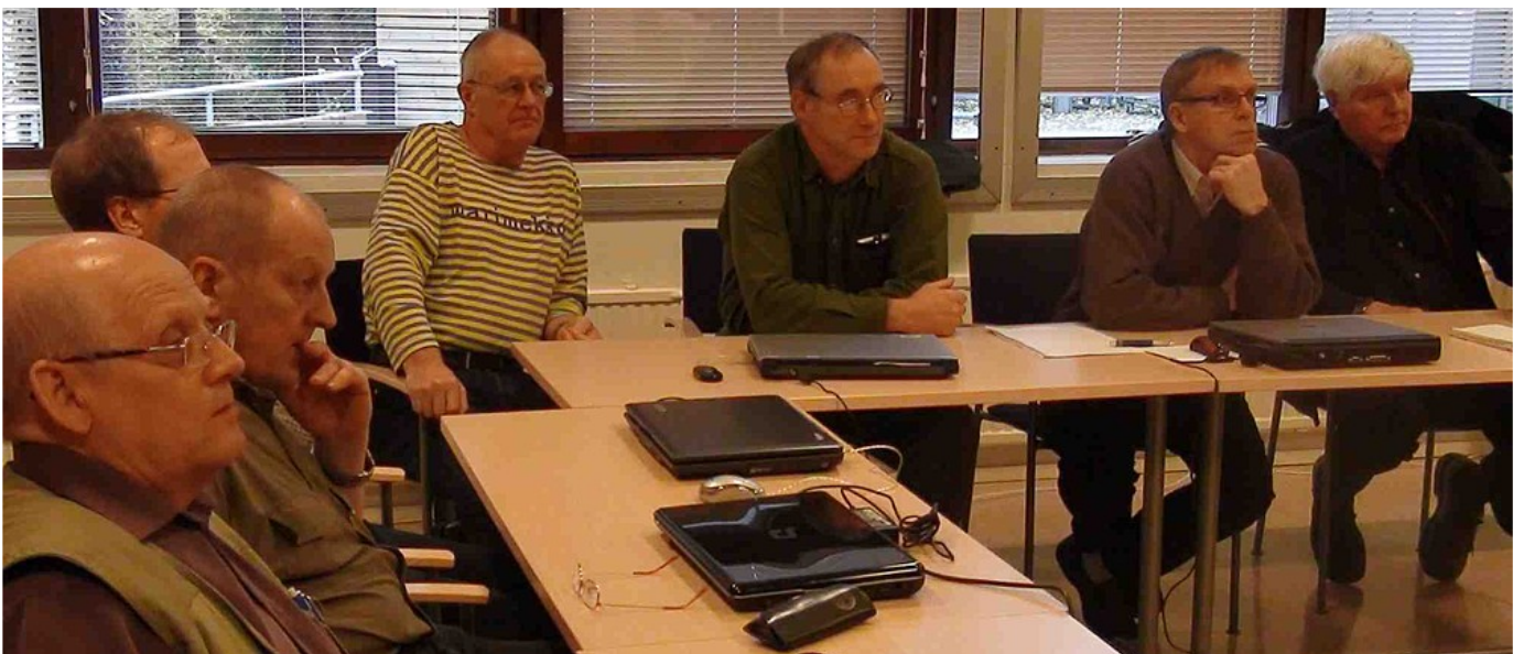
Tuotoksia tarkastellaan tarkkaavaisesti

Netti ja erityisesti wikipedia sekä sivu http://www.ilmaisohjelmat.fi/ osoittautuivat hyvik-