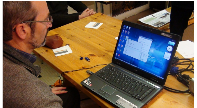
Scribus-ohjelman asentaminen vaati tiukkaa keskittymistä

miiksi kasassa paljon tekstiä ja valtava määrä kuvia. Tätä materiaalia hiottiin aika tavalla ja suuresta kuvamäärästä tärkeimpien valikoiminen vei paljon aikaa ja energiaa. Scribus-ohjelman lataaminen muistitikuilta epäonnistui täysin, joten jouduimme lataamaan ohjelmaa suoraan netistä tuntikaupalla, ja tämä viivästytti sivujen valmistamista. Eräs talkoolainen ehdottikin, että ohjelmat voisi ladata netistä omille koneille jo etukäteen ennen talkoopäivää nopeammilla nettiyhteyksillä.