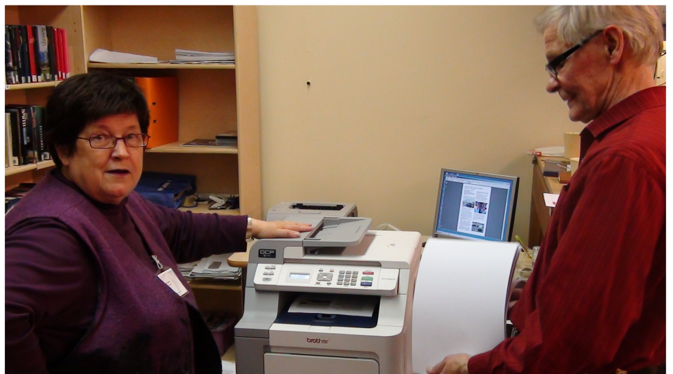
Kopiointi sujui hyvällä organisoinnilla ja yhteistyöllä

miiksi kasassa paljon tekstiä ja valtava määrä kuvia. Tätä materiaalia hiottiin aika tavalla ja suuresta kuvamäärästä tärkeimpien valikoiminen vei paljon aikaa ja energiaa. Scribus-ohjelman lataaminen muistitikuilta epäonnistui täysin, joten jouduimme lataamaan ohjelmaa suoraan netistä tuntikaupalla, ja tämä viivästytti sivujen valmistamista. Eräs talkoolainen ehdottikin, että ohjelmat voisi ladata netistä omille koneille jo etukäteen ennen talkoopäivää nopeammilla nettiyhteyksillä.