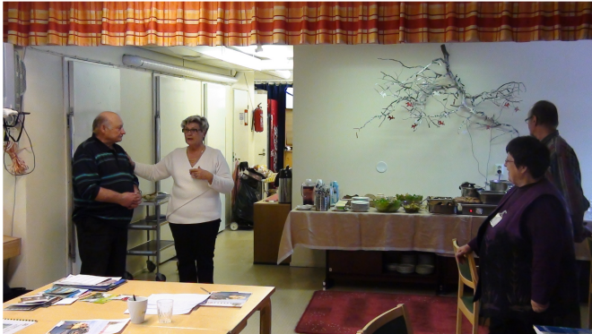
Songan kylätalo oli hyvä paikka talkoiden pitämiseen

Päivän tarkoituksena oli tehdä matkajulkaisu Songan kylän Eurooppa-kerhon syyskuisesta Kroatian matkasta. Songassahan on oltu Tietotaitotaloiden merkeissä jo aikaisemminkin, joten osalle talkookonsepti oli jo tuttu. Talkoot sujuivat sutjakasti hyvässä hengessä – joskaan teknisiltä ongelmilta ei taaskaan välttytty.