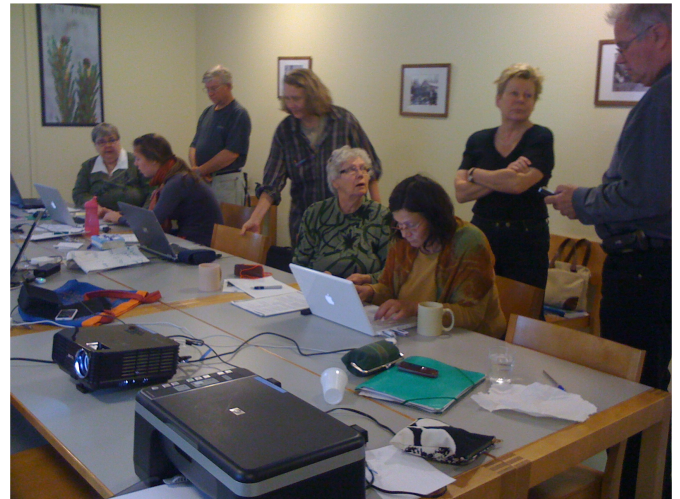
Talkootyöskentely sujuu mukavasti ison pöydän ääressä